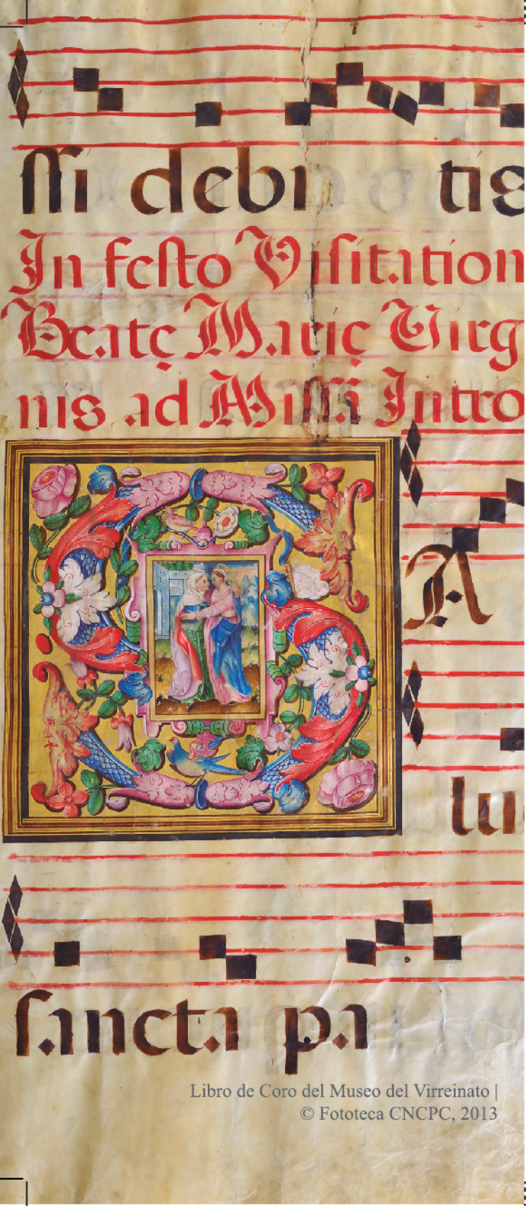
Libro de Coro del Museo del Virreinato