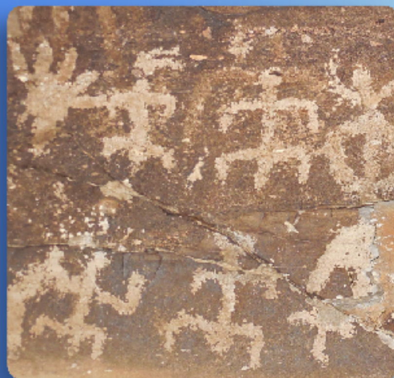
Samalayuca, Chihuahua

Los especialistas y la sociedad conservamos los sitios con gráfica rupestre para las personas del presente y las futuras generaciones.