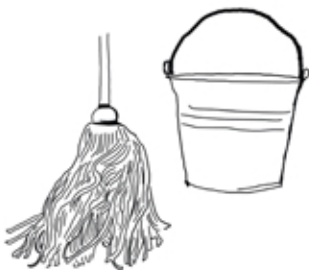
Achto ticchipahuaz tlapantli, zatepan ticpiaz misa