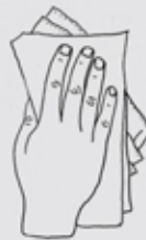
Tictlahuatzaz ixquichtin ica huacqui totzomatli

Aic ticchipahuazqueh yuhqui: retablos, pinturas, ahnozo huehue esculturas