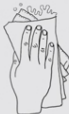
Tictlacuaniz xapo ica paltic totzomatli