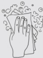
Achto ticchipahuazqueh xapo ihuan atl, ohpa