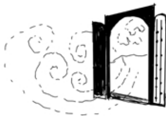
Achto tic-ehecatiz toteopan, zatepan ticalaquizqueh ihuan ticpiazqueh misa