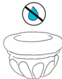
Tictlahuatza in atequilizteapaztli

Ticchipahuazqueh ixquich, manijas ihuan tlatquitl, ticchipahuaz in icpaltin